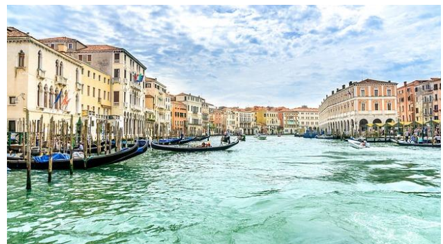
1 Programtag in Venedig